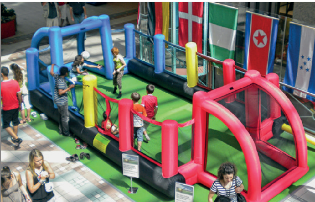
Dieser Kinder-Fussballplatz steht am Märtkafi.

Es ist eine wöchentliche Tradition am Rohrdorferberg (und rundum): Das Märtkafi in Niederrohrdorf. Hier trifft man sich, Samstag für Samstag jeweils am Vormittag, um neben Kaffee und Gipfeli ein kleines Plauderstündchen innerhalb der hiesigen Bevölkerung zu geniessen.