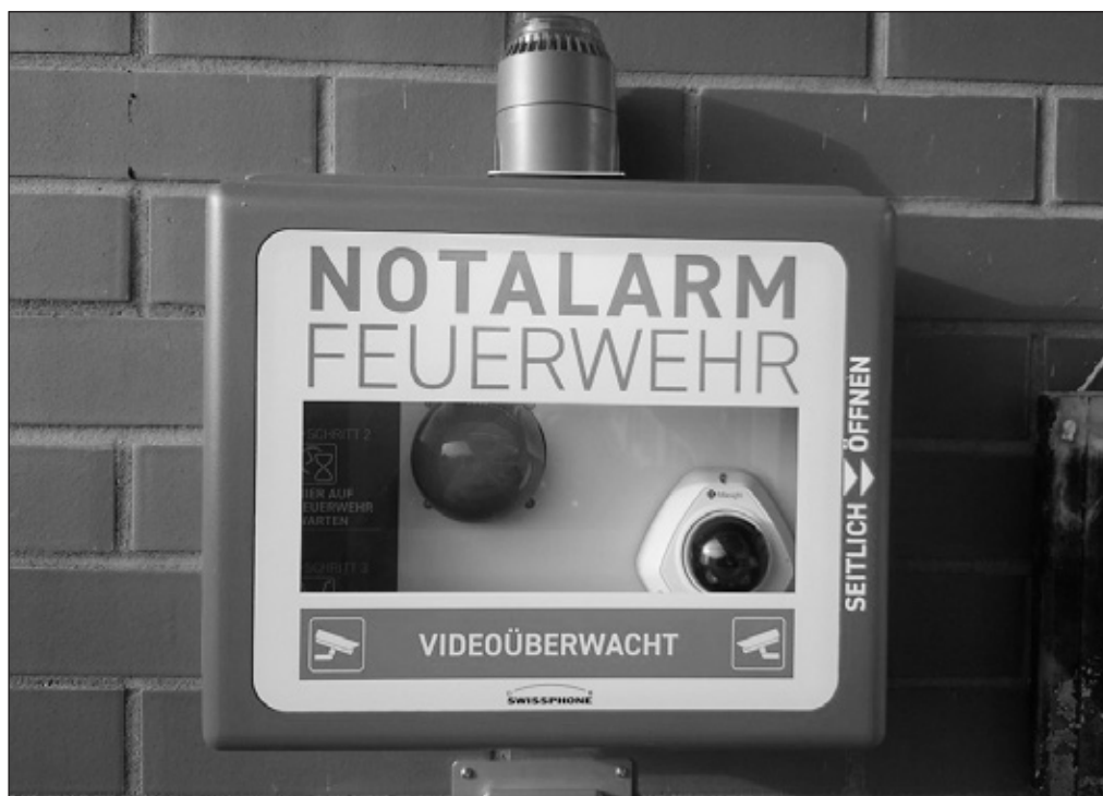
Notalarmknopf beim Eingang zum Feuerwehrmagazin in Niederrohrdorf

Grundsätzlich kann die Feuerwehr Rohrdorf während des ganzen Jahres und rund um die Uhr über die Telefonnummer 118 alarmiert werden. Dies ist im Normalbetrieb der sicherste und schnellste Weg um notwendige Hilfe zu erhalten.